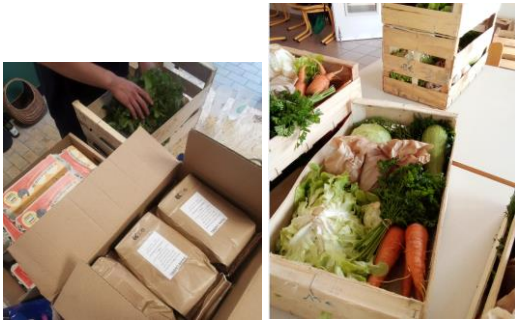
Paniers solidaires de produits locaux

La somme remise est en fonction de la composition familiale. Des chèques vont être remis jusqu'à mars 2025. D'autres foyers vont être engagés dans le projet en 2025.