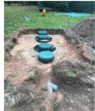
Pose d'une filière compacte

Par ailleurs, au total, l'Intercom a réalisé 141 contrôles de bonne exécution dans le cadre d'un projet de réhabilitation ou de construction neuve menés par les particuliers directement.