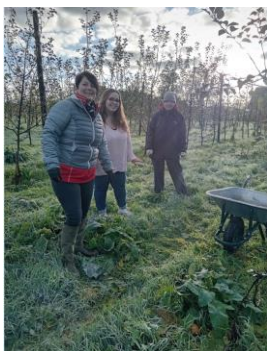
Glanage de pommes