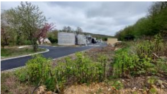
Station d'épuration de Broglie – avril 2024

La réalisation de ces projets est facilitée par les aides complémentaires de l'Agence de l'Eau Seine-Normandie, et du Département de l'Eure.