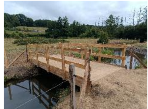
Figure 2 : Passerelle bétail