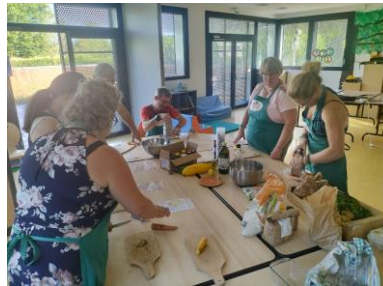
atelier de cuisine