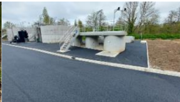
Station d'épuration de Broglie – Avril 2024