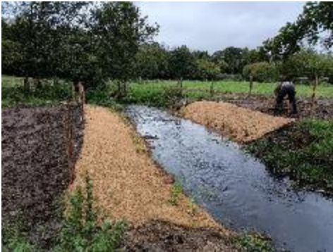
Figure 1 : Restauration de berges