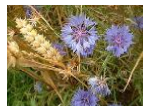
Le bleuet, plante messicole