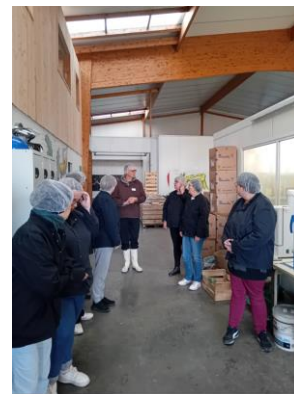
Atelier découverte conserverie

Ce projet contribue aux objectifs du Projet Alimentaire Territorial et du Contrat Local de Santé (Axe Nutrition). Il est co-piloté par le service agriculture et la chargée de mission santé de l'Intercom.