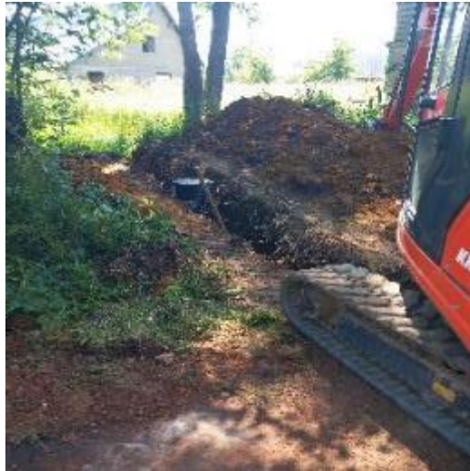
Aménagement d'un trop plein pour éviter le débordement d'une mare

Suite aux inondations de mai 2024, un recensement des problèmes a été réalisé et sera complété avec des réunions par bassin versant permettant une priorisation des travaux.