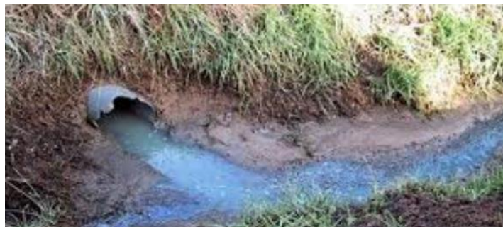
Rejet d'eaux usées dans un fossé à ciel ouvert

A l'issue de chaque visite, un rapport est rédigé et envoyé au propriétaire. Selon la classification, le propriétaire peut avoir l'obligation de réaliser des travaux.